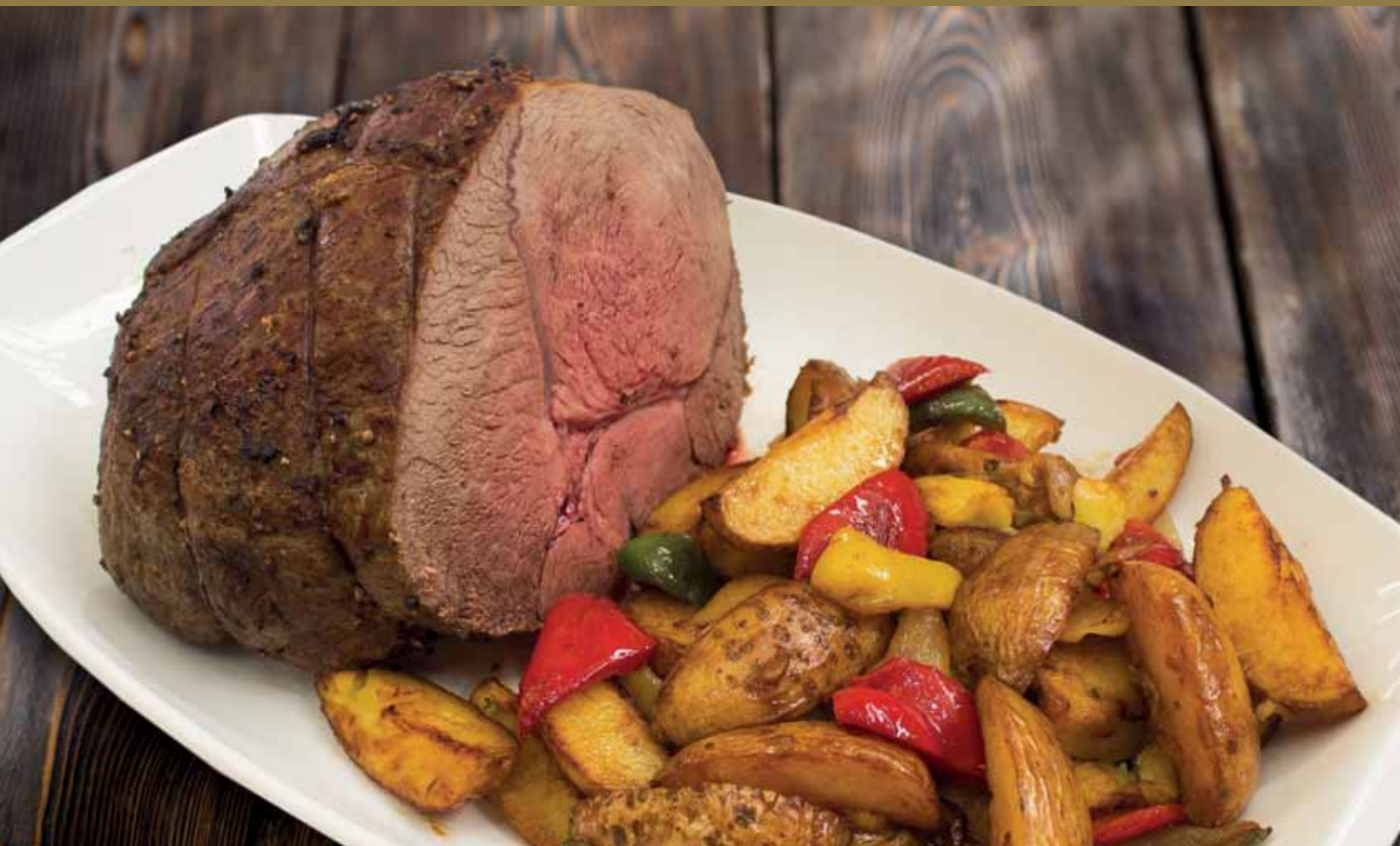
РОСТБИФ С ОВОЩАМИ Оковалок говядины, картофель отварной, перец болгарский, лук репчатый, чеснок.