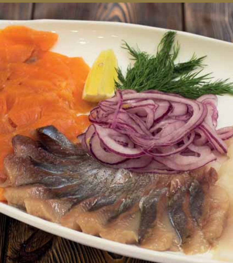
РЫБНОЕ АССОРТИ Форель малосольная, палтус малосольный, сельдь копченая, лимон, лук красный, зелень.