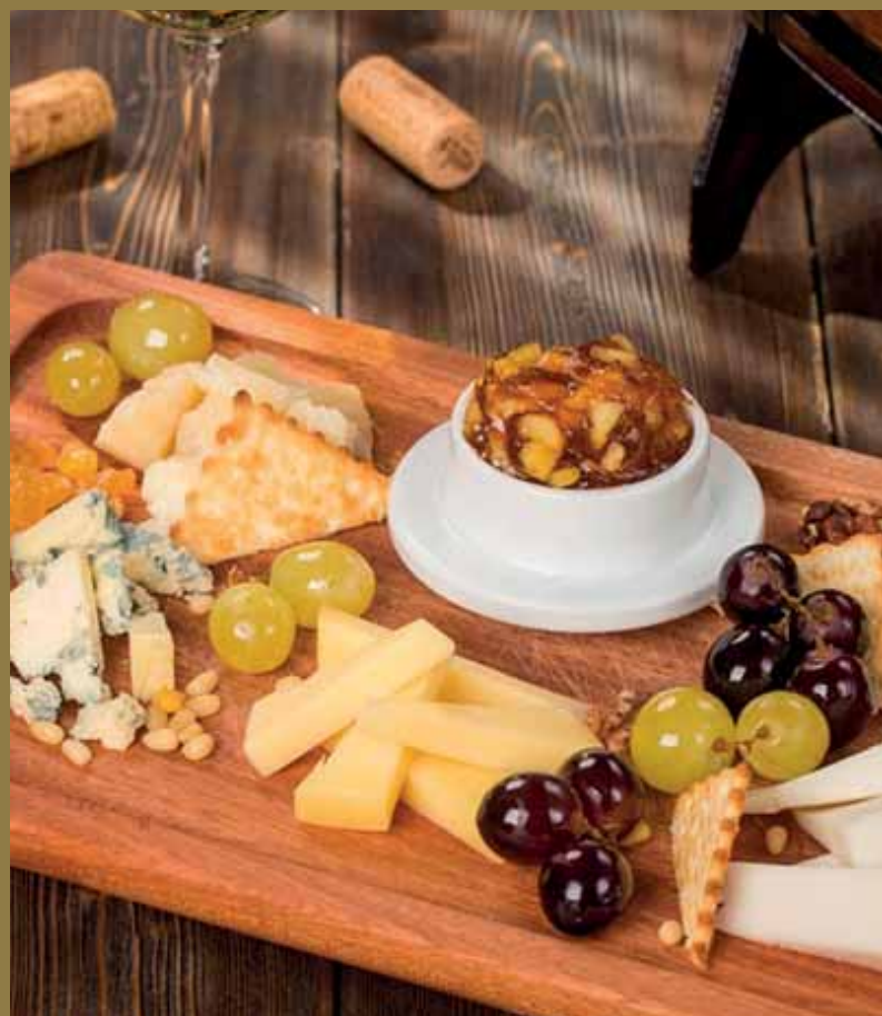
СЫРНОЕ АССОРТИ Маасдам, сыр козий, пармезан, сыр бри, дорблю, грецкий орех, крекер, виноград, конфитюр из яблок.