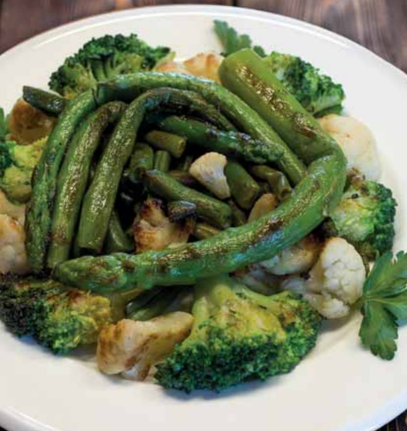
МИКС БРОККОЛИ И ЦВЕТНОЙ КАПУСТЫ