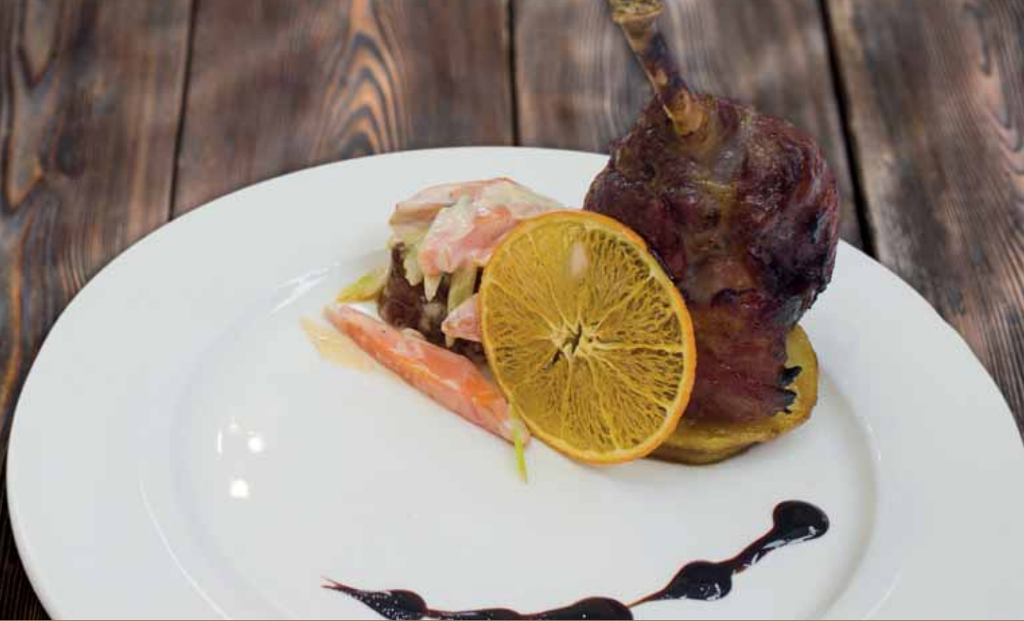
НОЖКА УТИНАЯ, ФАРШИРОВАННАЯ ЯБЛОКАМИ Утиная ножка, яблоки, морковь, лук порей, бекон, специи.