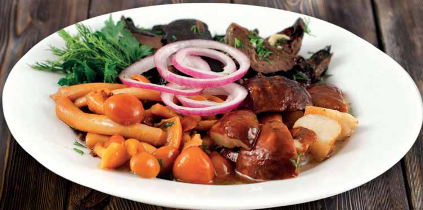
ГРИБНОЕ АССОРТИ Маринованные опята, вешенки, шампиньоны, лук красный, зелень.